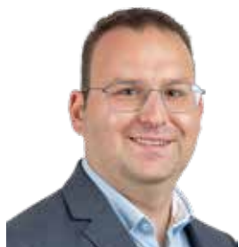
Plaats 4 gemeenteraad Plaats 7 provincieraad